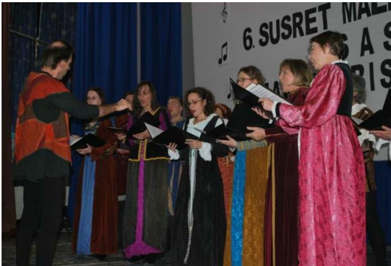
Hrvatska smotra u Mariji Bistrici 2009.