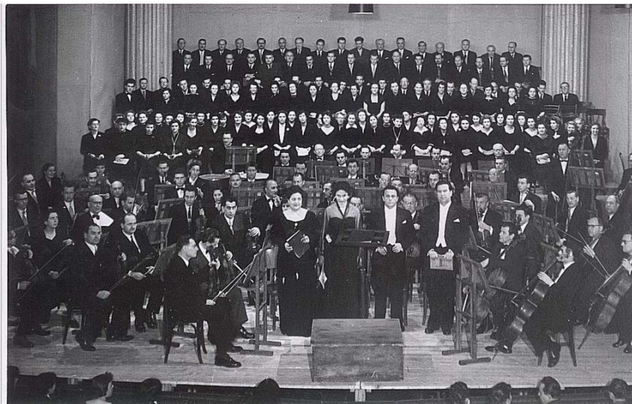
Lisinski izvodi Beethovenovu 9. simfoniju

Osim toga, Društvo je održalo tradicionalne nikolinjske i silvestarske zabave, kao i nekoliko društvenih čajanki i domjenaka.