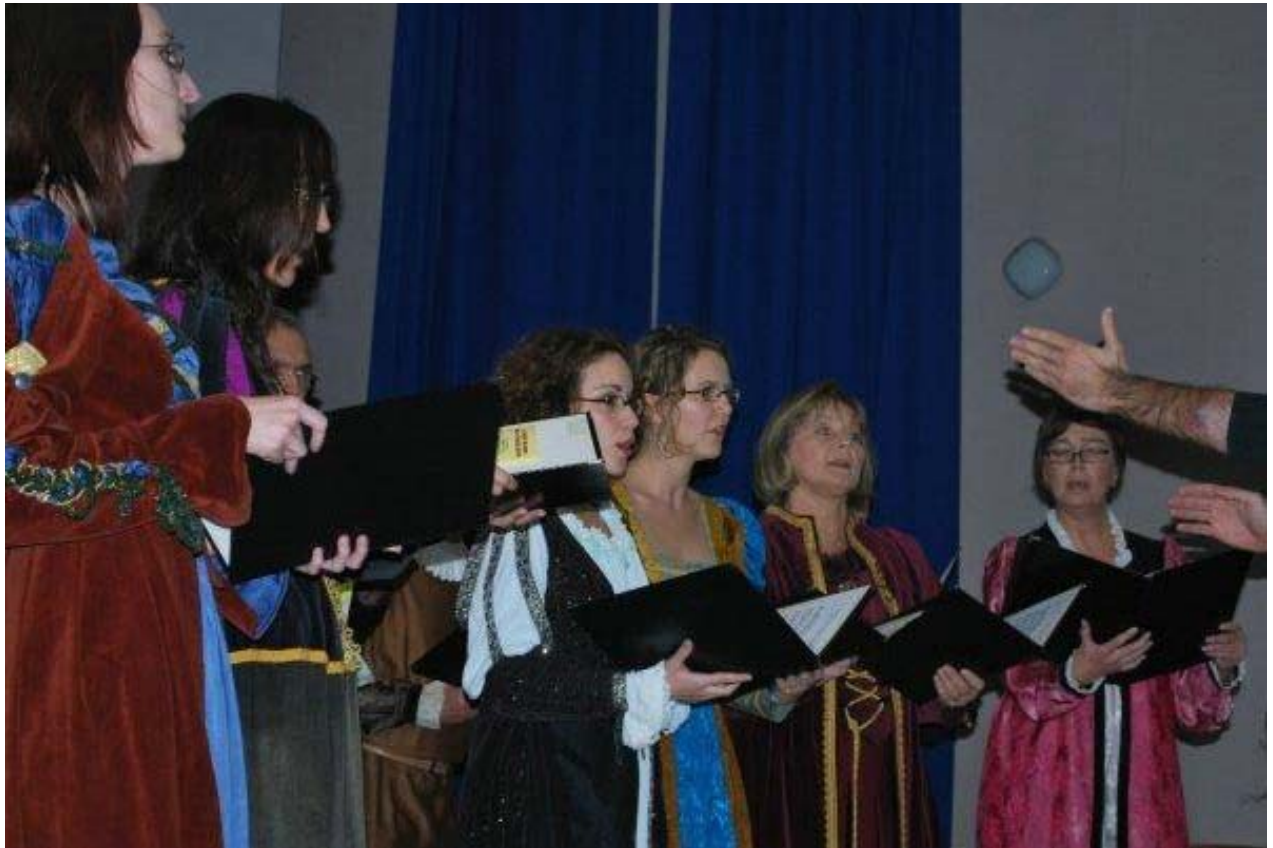
Hrvatska smotra u Mariji Bistrici 2009.