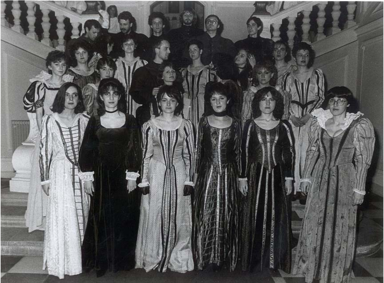
RA u HGZ-u oko 1984.

Već mjesec nakon svog osnutka 1983. Renesansni ansambl nastupa na Smotri pjevačkih zborova i vokalnih ansambala zagrebačke regije, te zauzima vrlo dobro mjesto na listi koju je stručni žiri sastavio po kvaliteti ansambala. Te je godine Ansambl imao četiri nastupa, a njihov je broj svake godine rastao, tako da sada nastupa dvadesetak puta godišnje, od čega su gotovo polovica cjelovečernji koncerti.