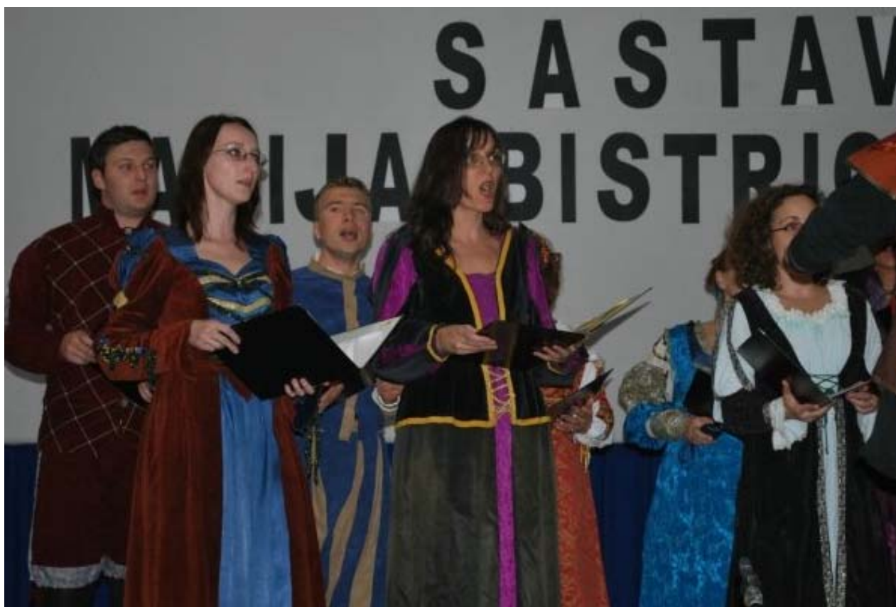
Hrvatska smotra u Mariji Bistrici 2009.