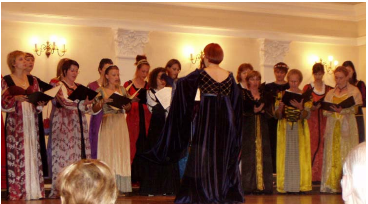
Smotra u HGZ-u 2005.