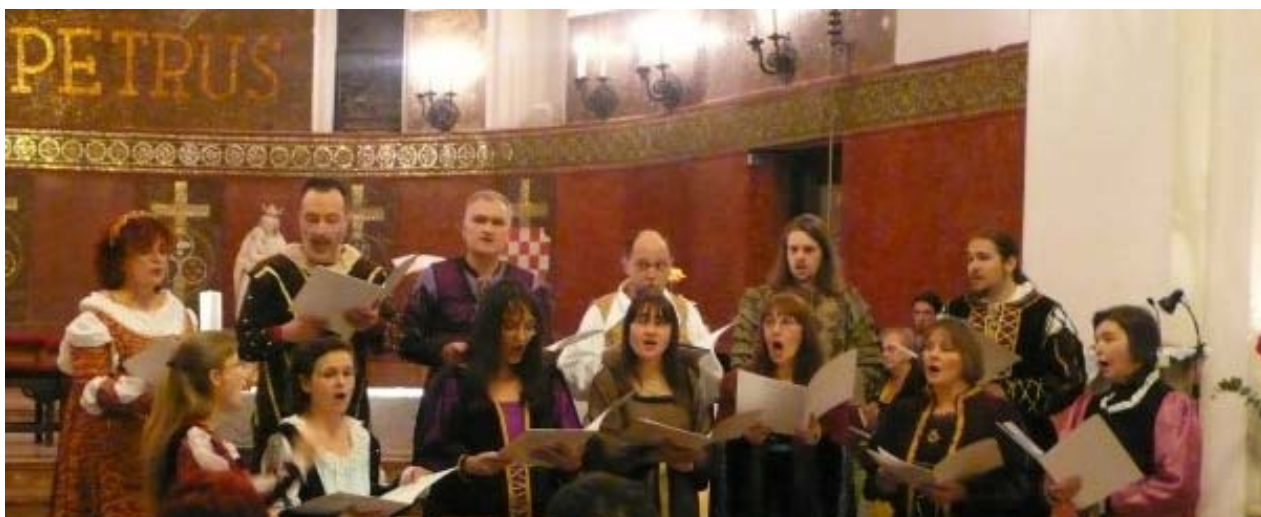
crkva sv. Petra 2009.